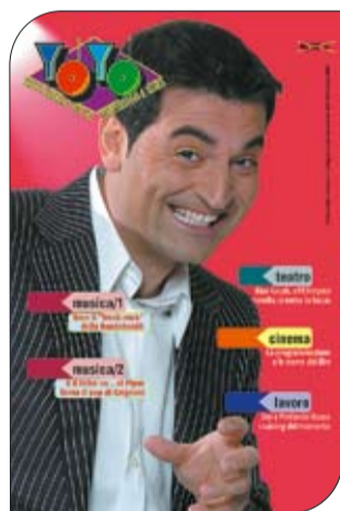
La copertina del primo numero di "YoYo", supplemento del settimanale Lavorare

Il settimanale edito dalla CCIAA di Roma regala, ogni martedì, YoYo: 24 pagine full color su teatro, cinema, musical e concerti